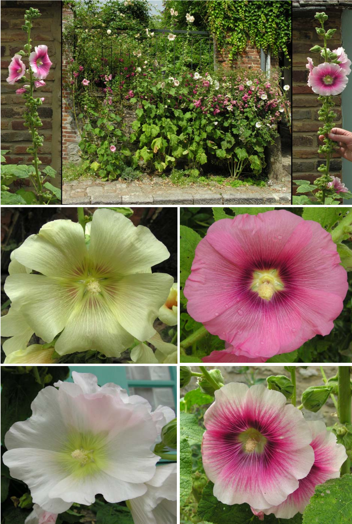
Quelques roses trémières, fleurs traditionnelles des jardins du nord de la France